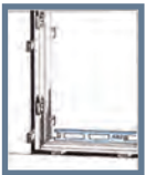
Bild 1: Kontrollera först att underlaget för tröskel är i våg. Lyft in karmen och kontrollera att tröskeln är i vattring. Ställ karmen på klossar så att isoleringen ryms. Det är viktigt att tröskeln har stöd i hela sin bredd.

Material SOM BEHÖVS VID MONTERING: KARMSKRUV (70-90 MM), KILAR, BRANDHÄRDIGT TÄTNINGSMATERIAL.