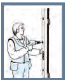
Bild 3: Låssidan ska också vara i lod och inte luta inåt eller utåt. Skruva fast låssidan. Fäst den på samma sätt som gångjärnssidan.

Se till att det även finns utrymme för tätning runt karmen. Skruva först gångjärnssidan med karmhylsa. Avståndet mellan karm och vägg avgör vilken längd på fästskruv som ska användas. Kravet på monteringsdjup i träregeln är minst 45 mm. Fortsätt att kila resten av karmen enligt ovan.