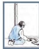
Bild 6: Kapa kilarna i nivå med karmen. Isolera mellanrummet mellan karm och vägg noga med vindtät isolering. Drevning ska anbringas invändigt och utvändigt. Drevna dock inte så hårt att karmen buktar. Den måste kunna andas, så att inte fukt stängs in. Komplettera med fogmassa på utsida för ljud- och fuktisolering.

Bild 5: Häng på dörrbladet och kontrollera att springan mellan dörrblad och karm runt om är jämn. Mät noga för att undvika att karmen är skev i förhållande till dörrbladet. Kontrollera att dörren går lätt att öppna och stänga och finjustera karmen om det behövs. På så sätt förebygger du framtida problem. Om det skulle vara ett glapp vid slutblecket kan du justera detta genom att böja ut tungan i slutblecket. Hänger dörren för lågt, använd justerings-brickor som man sätter i gångjärnet på dörrdelen. Det finns också ställbar skruv i gångjärnet för justering i sidled.