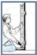
Bild 2: Kila karmen så att gångjärnssidan kommer i lod och kontrollera med långvattenpass. OBS! Kilning ska alltid finnas mellan slutbleck och vägg samt mellan gångjärn och vägg, dvs. tre kilpunkter på båda karmsidor. Karmen måste vara rak. Det är viktigt att du placerar kilarna parvis, inifrån och utifrån, så att karmen kommer att vara i lod både inåt och utåt.

Bild 1: Kontrollera först att underlaget för tröskel är i våg. Lyft in karmen och kontrollera att tröskeln är i vattring. Ställ karmen på klossar så att isoleringen ryms. Det är viktigt att tröskeln har stöd i hela sin bredd.