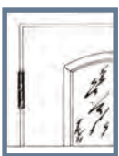
Bild 5: Häng på dörrbladet och kontrollera att springan mellan dörrblad och karm runt om är jämn. Mät noga för att undvika att karmen är skev i förhållande till dörrbladet. Kontrollera att dörren går lätt att öppna och stänga och finjustera karmen om det behövs. På så sätt förebygger du framtida problem. Om det skulle vara ett glapp vid slutblecket kan du justera detta genom att böja ut tungan i slutblecket. Hänger dörren för lågt, använd justerings-brickor som man sätter i gångjärnet på dörrdelen. Det finns också ställbar skruv i gångjärnet för justering i sidled.

Bild 4: Ta två träribbor och mät diagonalerna åt båda håll i karmens hörn. De ska vara lika långa. Om måttet inte skulle stämma, lossa skruvarna och justera med kilarna.