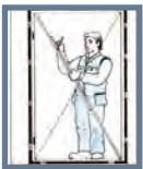
Bild 4: Ta två träribbor och mät diagonalerna åt båda håll i karmens hörn. De ska vara lika långa. Om måttet inte skulle stämma, lossa skruvarna och justera med kilarna.

Bild 3: Låssidan ska också vara i lod och inte luta inåt eller utåt. Skruva fast låssidan. Fäst den på samma sätt som gångjärnssidan.